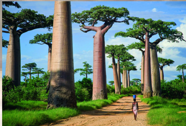
Viale dei Baobab

L'albero più famoso del Madagascar è il Baobab. Questi sono alberi massicci e alti con rami irregolari e tronchi che contengono fino a 300 litri di acqua e possono vivere più di 500 anni.