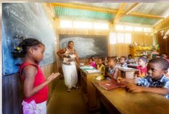
Esempio di scuola in Madagascar

Grazie alla collaborazione tra tour operator ed una associazione Onlus è stata costruita una nuova scuola che può accogliere 350 alunni in 14 aule, oltre a provvedere alla fornitura di materiale scolastico.