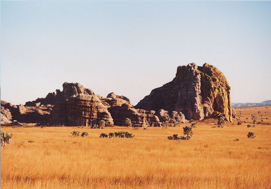
parco nazionale dell-isalo

Nel sud si trovano aree coperte da savana e steppa con tanti fichi d'India.