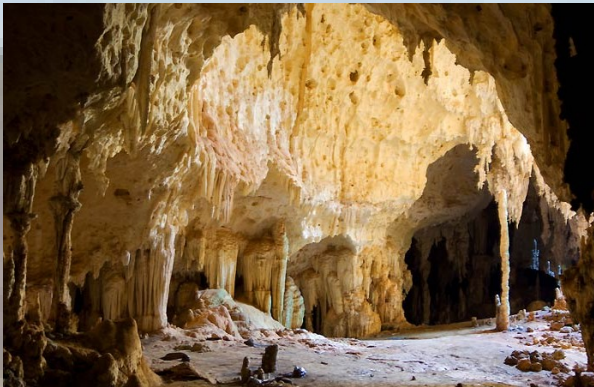
LE GROTTI DI ANDRAFIABE

queste grotte sono dei veri labirinti , molto lunghe e pericolose . Le